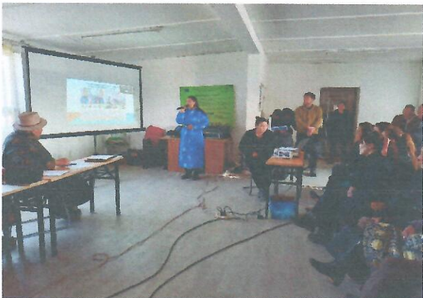
Зураг 3. Цоохор 4-р багт хийсэн сургалтын үеийн зураг

5. Авлигын эсрэг сургалт, Авлигын эсрэг үндэсний хөтөлбөрийг Төрийн албан хаагч, иргэд сургалтыг хийсэн. Нийт 190 иргэн хамрагдсан.