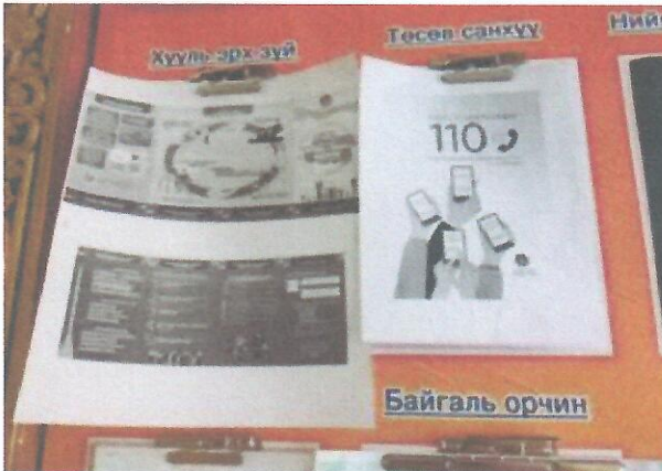
Зураг 2. Мэдээллийн самбарт байршуулсан байдал