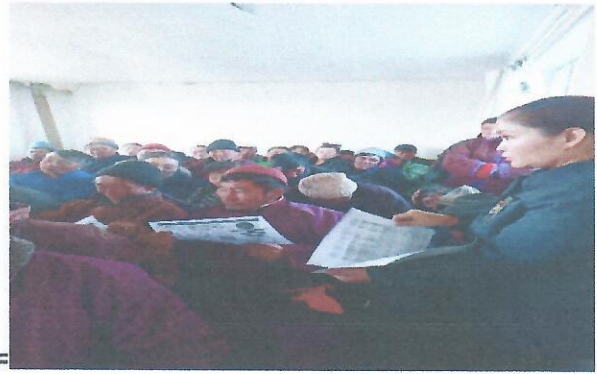
Зураг 5. Өрхт 2-р багт хийсэн сургалтын үеийн зураг