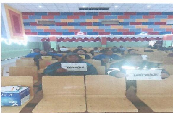
Зураг 1. Авлигын эсрэг уриалгад нэгдсэн байдал

2. Авлигатай тэмцэх газраас санаачилсан аян, арга хэмжээнд цахим орчинд байршуулсан. Аян арга хэмжээг өөрийн орон нутагтаа зохион байгуулан иргэд, малчдыг соён гэгээрүүлэх ажлыг зохион байгуулан ажиллаа.