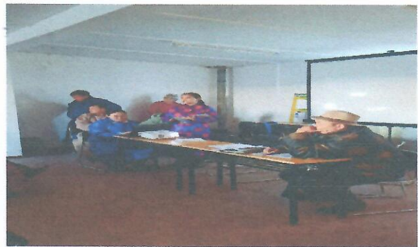
Зураг 6. Хэлтгий булаг 1-р багийн сургалтын үеийн зураг