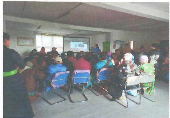
Зураг 4. Залаа 3-р багт хийсэн сургалтын үеийн зураг